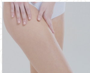
医療レーザー脱毛